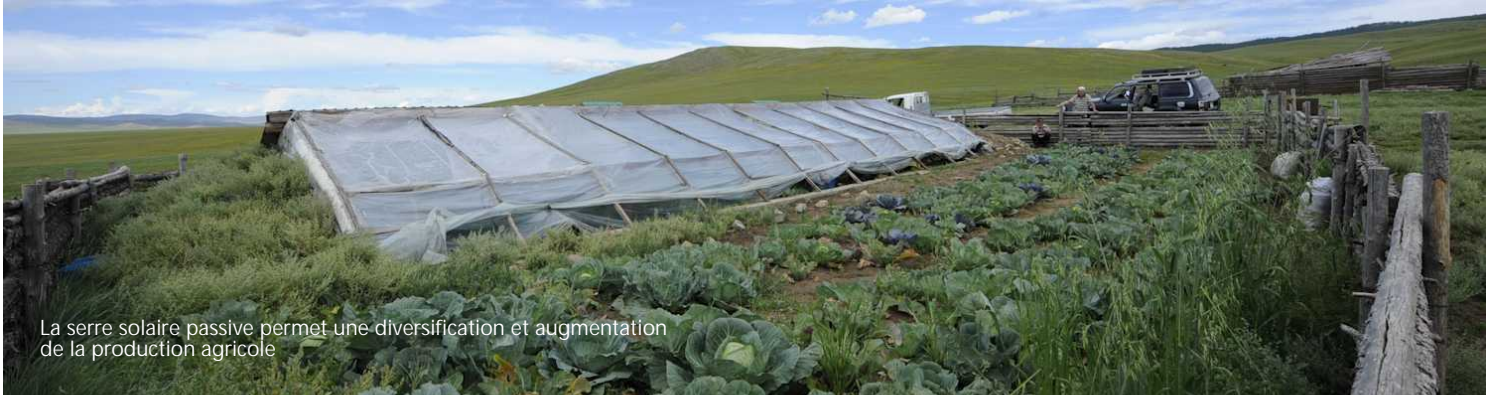
La serre solaire passive permet une diversification et augmentation de la production agricole

Implantation pilote de serres bioclimatiques en région PACA pour soutenir les agriculteurs locaux et préserver l'environnement