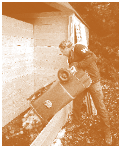
Introduction des déchets alimentaires au compostage

CPIE Alpes de Provence : éducation à l'environnement