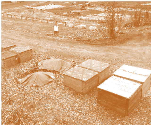
Plateforme de compostage de proximité

L'association A Fleur de Pierre a conduit en 2013-2014 le compostage en bacs dans un collège de la ville, en assurant les tâches de traitement des déchets alimentaires après leur tri dans l'établissement.