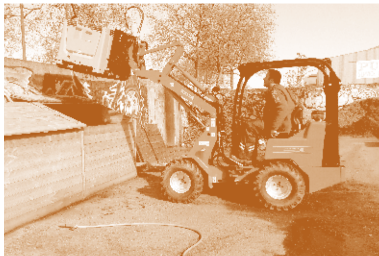
Installation gérée par le prestataire et opération de retournement mécanique