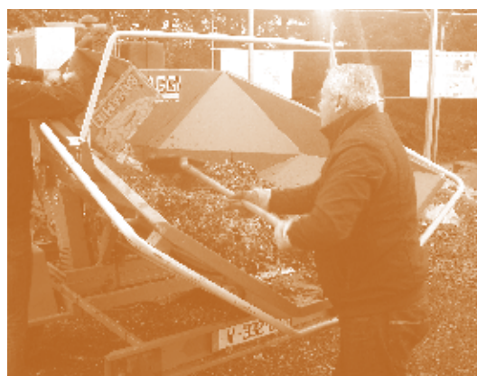
Test de broyage avec différents biodéchets - © Compost'Ere