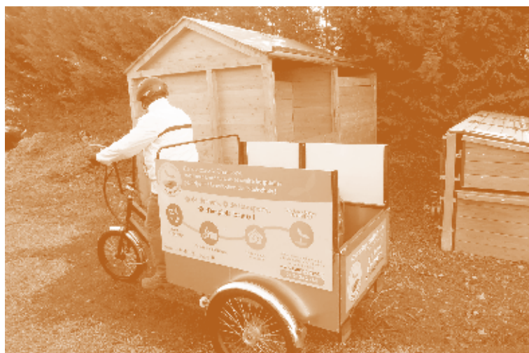
La collecte s'effectue en tricycle à assistance électrique