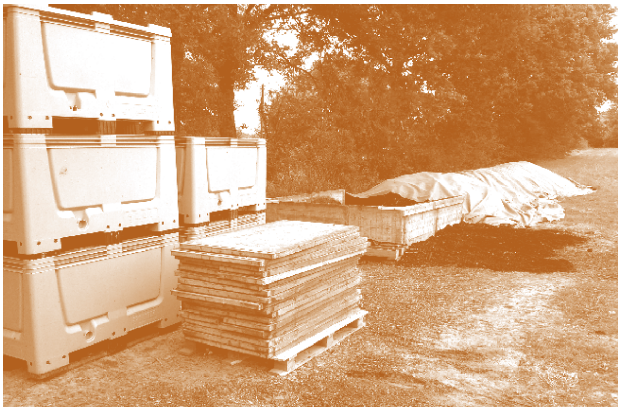
Paloque de précompostage avant prise en charge pour traitement extérieur