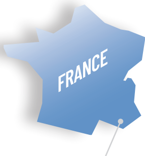
Pays d'Aubagne et de l'Étoile