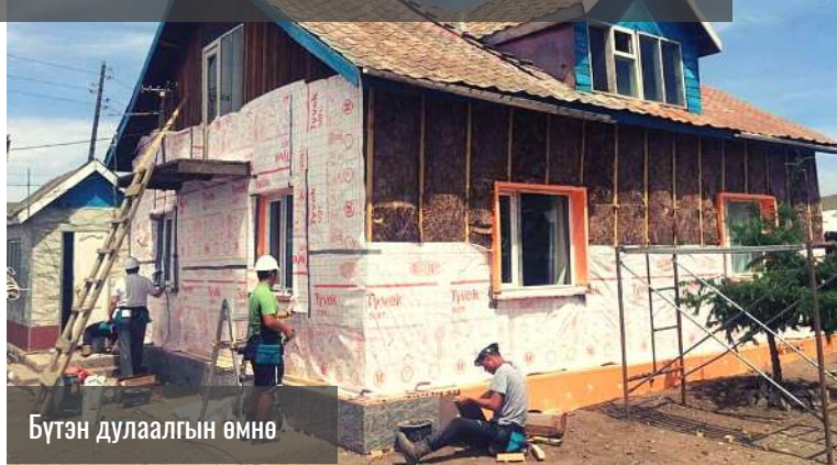
Бүтэн дулаалгын өмнө