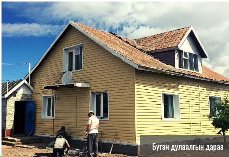
Бүтэн дулаалгын дараа